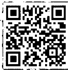
Hướng dẫn quyết toán thuế thu nhập cá nhân năm 2023

Trong quá trình thực hiện, nếu có vướng mắc, người nộp thuế vui lòng liên hệ với cơ quan thuế gần nhất hoặc truy cập website https://hanoi.gdt.gov.vn để được hướng dẫn.