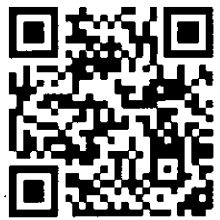
Cài đặt eTax Mobile (dành cho hệ điều hành Android)

Người nộp thuế là cá nhân hãy quét mã QR CODE dưới đây để cài đặt và sử dụng eTax Mobile khi thực hiện quyết toán thuế thu nhập cá nhân năm 2023: